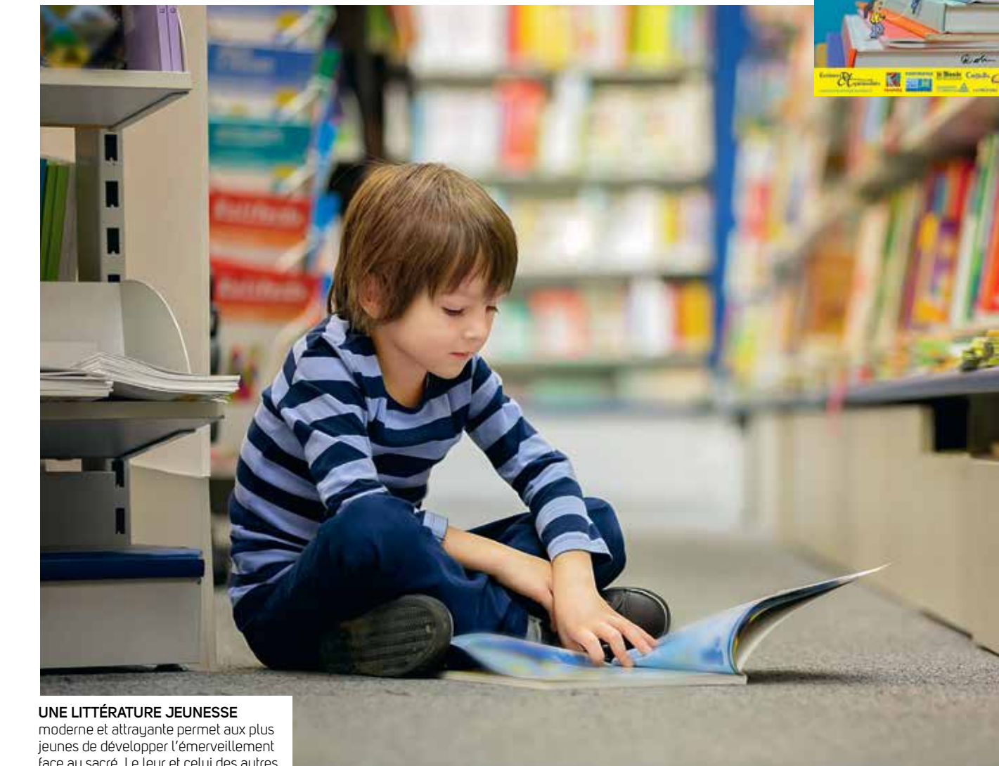
UNE LITTÉRATURE JEUNESSE moderne et attrayante permet aux plus jeunes de développer l'émerveillement face au sacré. Le leur et celui des autres.